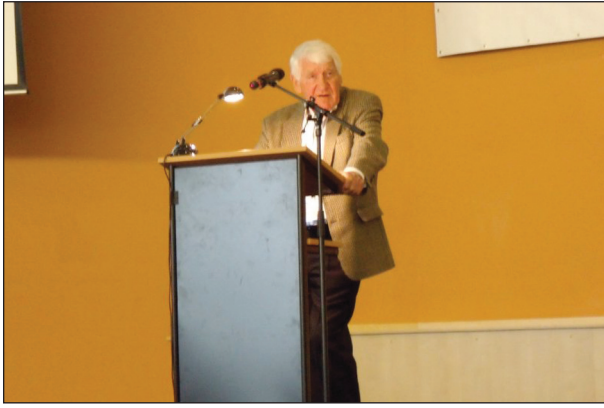
Obr. 3. Profesor Riehm při přednášce.

vzpomínal na první zkušenosti s aplikací jím vytvořených léčebných protokolů v západním Berlíně, odkud se inovativní a do té doby používané zásady léčby zásadně měnící léčba dětské ALL šířila do celé Spolkové Republiky Německo a následně do řady zemí světa. Principem léčebného přístupu byla velmi intenzivní dvouměsíční iniciační léčba skládající se z osmi cytostatik podaných v přesném časovém schématu a pozdní posílení (intenzifikace) léčby 6 měsíců od diagnózy obdobnými léky. Protokol byl kromě berlínské kliniky používán na dětských klinikách v Münsteru a ve Frankfurtu (odtud pochází název protokolu BFM používaný dosud). Svět v té době používal americké protokoly s šancí na vyléčení dětí s leukemií 30 %. Německými protokoly se vyléčilo v druhé polovině 70. let a v osmdesátých letech šedesát a následně 70 % dětí a staly se standardem léčby, jehož klíčové součásti používá většina vedoucích leukemických skupin včetně např. USA a Japonska.