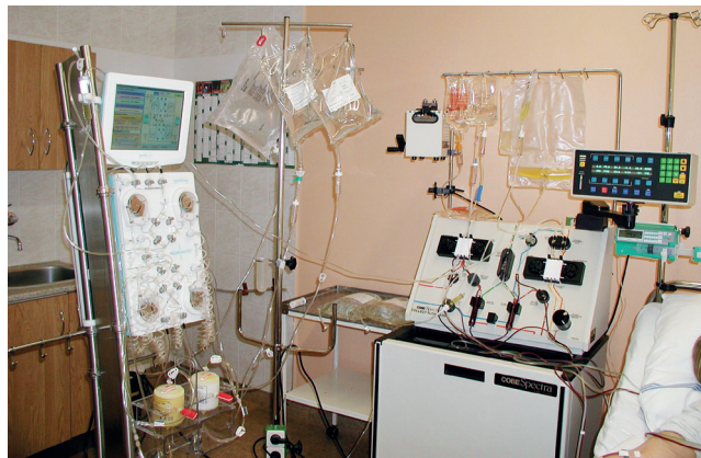
Foto 1 Přístrojové vybavení při LDL-aféřeze.

Princip reohemaferézy (RHF): U RHF je plazma, získaná stejným postupem jako u IA, proháňena “dru-