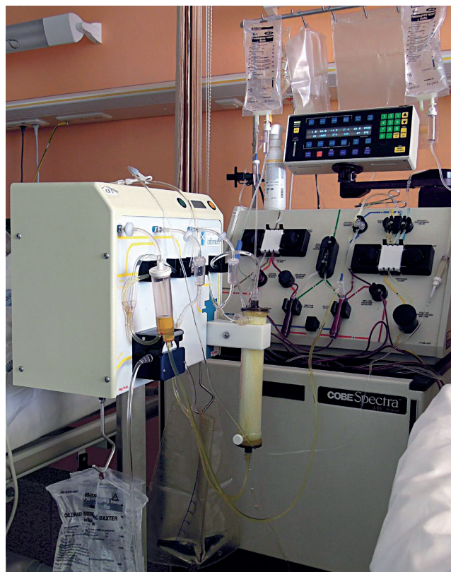
Foto 2 Přístrojové vybavení při reoferéze.

o toxicitu ACD-A (mírné klinické příznaky hypokalémie). Po infuzi s kalcíem (Calcium gluconicum 10%, Braun) došlo k vymizení potíží. Infuze s kalcíem u našich pacientů nepodáváme standardně při každém