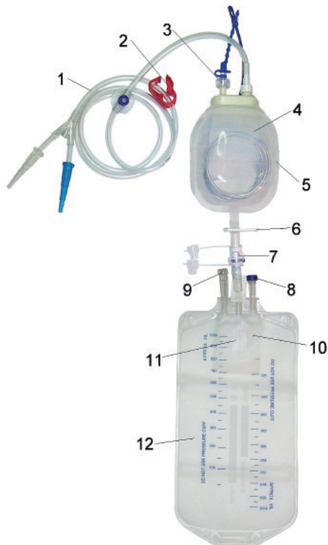
Obr. 1 Retransfuzní set ATS Bulb Set (verze s pružinou v odběrné baňce).

V prospektivní studii byl použit autotransfuzní systém ATS Bulb Set (10705, Redax, Poggio Rusco, Itálie) ve standardní verzi s dvojitou integrovanou filtrací. První 200mikronový filtr je umístěn v silikonové sběrné baňce o objemu 400 ml, druhý 40mikronový je vestavěn ve sběrném transfuzním vaku o objemu 1000 ml. Dvojitá filtrace zaručuje separaci makroagregátů i mikroagregátů před transfuzí a není tedy nutné využití dalších přídavných filtrů. Kontinuální drenáž rány je zaručena automatickým převodem krve ze sběrné baňky do transfuzního vaku po gravitačním spádu. Tento set generuje počáteční podtlak o hodnotě -50 mmHg (6,6 kPa) a poté pracuje při tlaku okolo -30 mmHg (4 kPa). Krev se shromažďuje do sběrného vaku maximálně do pěti hodin od připojení a zpětný převod krve musí být proveden do 6 hodin od počátku