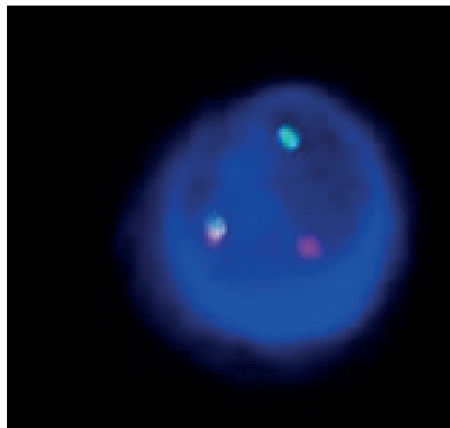
Obr. 1 Translokace t(4;14) A - standardní nález (2F1R1G), B - variantní nález (1F1R1G)

California, USA), která pokrývá geny FGFR3 , TMEN19 , TACC3 a LETM1 .