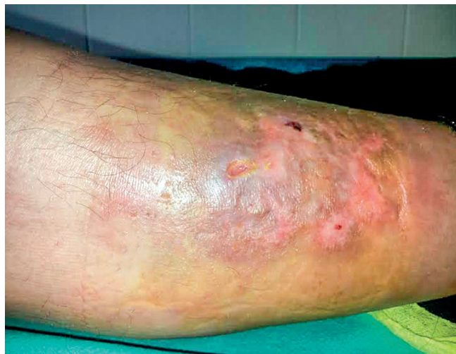
Obr 1. Necrobiosis lipoidica – nežiaduci účinok na koži predkolenia, ktorý vznikol v priebehu liečby IFN- \alpha u 52-ročnej pacientky s polycytémiou vera

IFN a začať s liečbou intravenóznymi imunoglobulínmi. Nežiaduce účinky, ktoré viedli k ukončeniu liečby, uvádza tabuľka 3. V celom súbore nežiaduce účinky viedli k ukončeniu liečby rIFN- \alpha u 13 (22 %) pacientov, s mediánom liečby 25 (3–48) mesiacov. Podávanie Peg-IFN- \alpha s mediánom 21 mesiacov, nevedlo ani v jednom prípade k ukončeniu liečby. Trombotické komplikácie malo v celom súbore 13 (22 %) chorých (tab. 4), 10 s diagnózou PV, v jednom prípade ET a dvaja s PMF. Z nich sa pred diagnózou MPN vyskytol u 2 pacientov