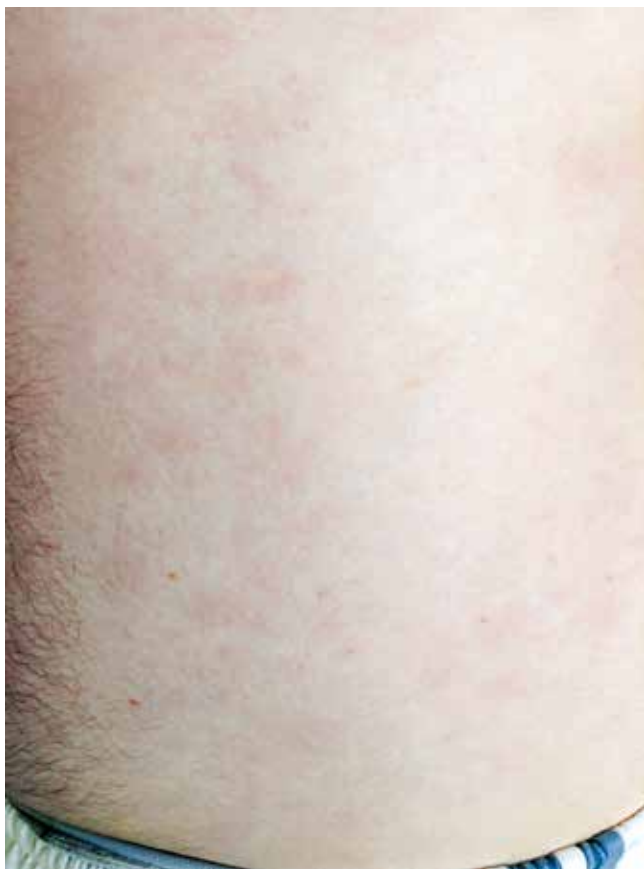
Obr. 2. Kožní léze na trupu, stav po zahájení předfáze kortikosteroidy

HLA-typizační vyšetření sestry nemocného neprokázalo shodu s pacientem, proto bylo zahájeno vyhledávání v registrech dárců kostní dřeně. Po dokončení standardních předtransplantačních vyšetření byl nemocný v červenci 2015 přijat k provedení alogenní TKB od nepříbuzenského dárce, 23letého muže, HLA inkompatibilního (1 neshoda na lokusu A), AB0 inkompatibilního (příjemce B+, dárce 0+), CMV negativního. Po