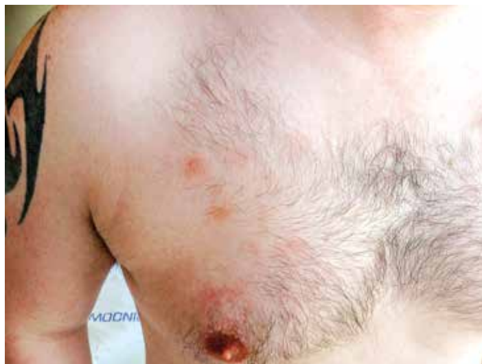
Obr. 3. Detail kožní léze na trupu, stav po zahájení předfáze kortikosteroidy

přípravném režimu s redukovanou intenzitou (RIC) Flu + Mel + TG (fludarabin 150 mg/m 2 , melfalan 140 mg/m 2 , thymoglobulin 4,0 mg/kg), byl 23. 7. 2015 proveden převod štěpu s obsahem 4,29 x 10 6 /kg CD34+ a 2,65 x 10 8 /kg jaderných buněk. Komplikací v potransplantačním období byl rozvoj klostridiové enteritidy (pozitivní klostridiový toxin i antigen) s promptním ústupem potíží na terapii metronidazolem per os. Další průběh hospitalizace byl již bez potíží. Nemocný byl propuštěn v den +25 po transplantaci ve stabilizovaném stavu do ambulantní péče. Prevence GVHD ( graft-versus-host disease ) byla zajištěna kombinací cyklosporinu A (CyA) a mykofenolát mofetilu (MMF). Aplikace CyA byla zahájena v den -1 před transplantací v dávce 6 mg/kg denně a následně korigována, s cílem udržet v časném potransplantačním období hladinu 200–300 ng/ml. Při absenci jakýchkoliv známek GVHD byla redukce CyA zahájena v den +56 s cílem pozvolného vysazení do dne +110 až 130 po TKB při remisi základního onemocnění a 100% dárcovském buněčném chimérismu. Podávání MMF bylo zahájeno v den +1 v dávce 30 mg/kg/den, s redukcí a postupným vysazením mezi dny +29 a +56.