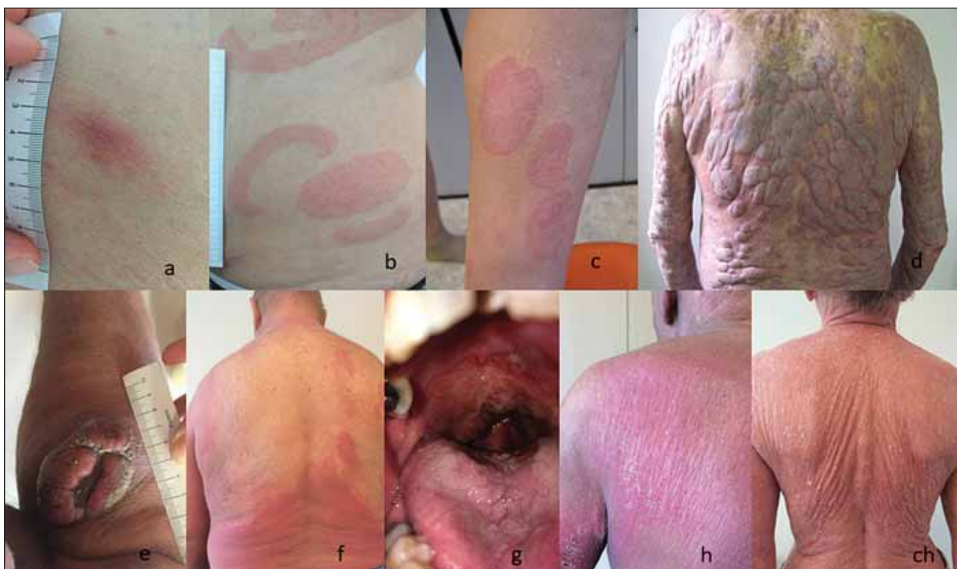
Obr. 1. Projevy MF a SS; fotografie autora článku.

(a) stádium skvrn (patch) MF, (b, c) infiltrativní stádium MF (plaque); (d, e) tumorozní stádium MF; (f) erythrodermické stádium MF; (g) MF mimokožní systémové postižení; (h, ch) SS (erythrodermie) MF – mycosis fungoides, SS – Sézaryho syndrom