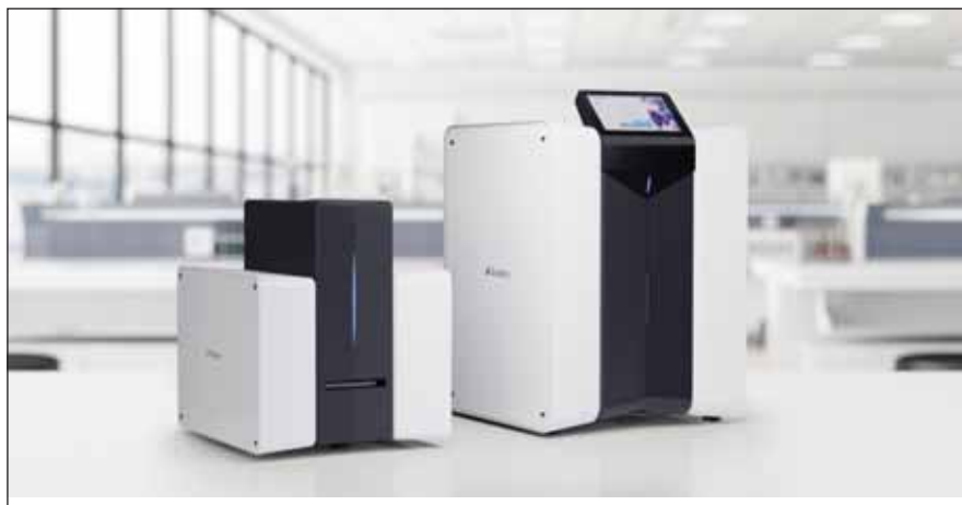
Obr. 2. Dvě kapacitní varianty zařízení Scpio.