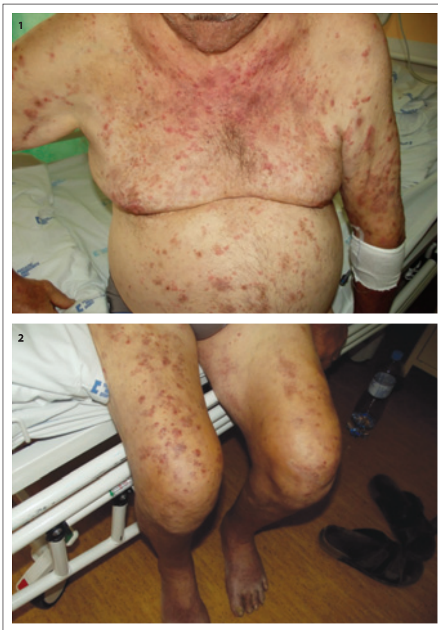
Obr. 1 a 2. Kožní změny při VEXAS syndromu, dermatologická diagnóza byla neutrofilní dermatitida, Sweetův syndrom.

Periferní krev byla odeslána na molekulárně biologické vyšetření do Ústavu