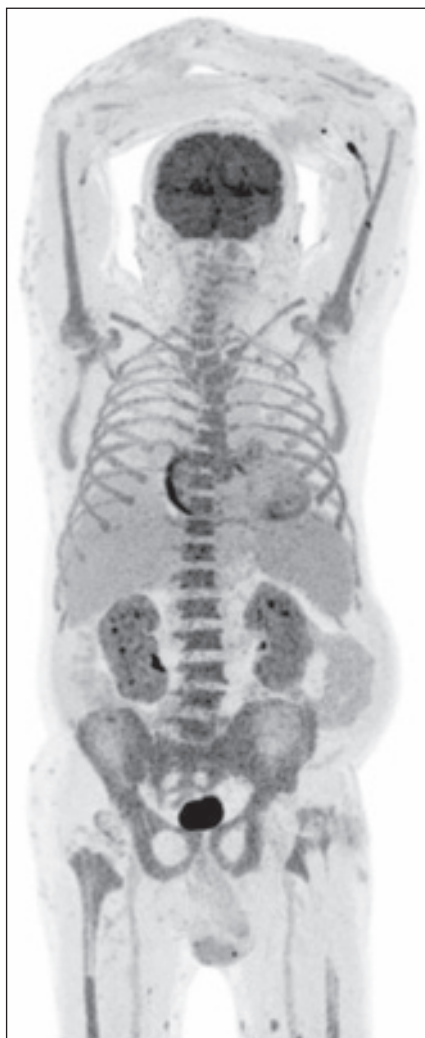
Obr. 4. Ložiska s jasně patologickou akumulací FDG nebyla nalezena, ale abnormním nálezem je relativně vyšší akumulace FDG v kostní dřeni celého zachyceného skeletu (výpadky v místech TEP kyčlí), ( SUV_{max} do 6,38 v sakrální kosti). Normalizovala se akumulace FDG v horním laloku l. plíce po předchozí alveolitidě. Difúzně hraniční až mírně vyšší akumulace FDG ve slezině ( SUV_{max} 3,82) – v 1/2023 byla pod úroveň akumulace jaterní. Povrchově v kůži a podkoží HKK a DKK více drobných fokálních akumulací FDG ( SUV_{max} do 5,28 dorzálně v polovině levého stehna), méně i v kůži/podkoží hrudníku, břicha, boků, hýždí, a dalších místech.

Abnormalitou je rovněž aktivita ve stěně pravé síně srdeční (mimo standardní metabolicky aktivní stěnu LK srdeční). Další rozložení FDG v rozsahu snímání hlavy, trupu i končetin bez abnormalit. Nejsou známky metabolicky aktivních chrupavek (nos, uši, trachea) – jen jedna drobná fokální akumulace na levém ušním boltci ( SUV_{max} 5,7) – v kůži?