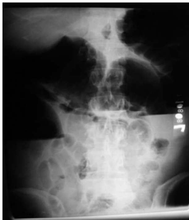
Obr. 1. RTG obraz ileózneho stavu.

V období rokov 2008–2011 sme na Chirurgickej klinike FNŠP Prešov hospitalizovali 185 pacientov s kolorektálnym karcinómom. Všetkým pacientom boli pri prijatí okrem krvného obrazu vyšetrené základné hemokoagulačné testy (protrombínový čas (PT), trombínový čas (TT), aktivovaný parciálny tromboplastínový čas (aPTT) a D diméry kvantitatívnym vyšetrením – STA Liatest D-Di, Diagnostika Stago. Pacienti boli vyšetrení kolonoskopicky, event. i gastrofibroskopicky vo vlastnej rýžii chirurgickej kliniky, event. v gastroenterologickej ambulancii našej nemocnice. V prípade potreby sme indikovali ultrasonografiu (USG), počítačovu tomografiu (CT), irrigoCT, resp. angioCT vyšetrenie na RTG odde-