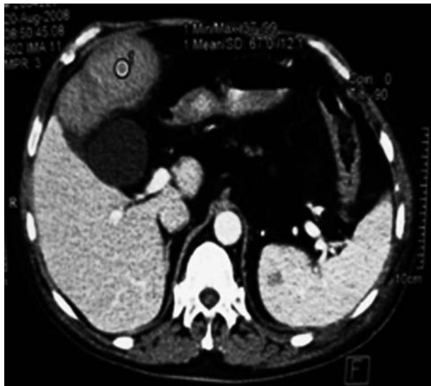
Obr. 2. CT obraz tumoru hepatálnej flexúry.

deň bolo vykonané CT vyšetrenie za účelom diferencovania a kontroly popísaného zápalového infiltrátu v oblasti hepatálnej flexúry. Röntgenológ potvrdil progresiu procesu oproti peroperačnému stavu s popisom tumoru hepatálnej flexúry veľkosti 13,5 x 7 cm (obr. 2). Pacient bol po operácii stabilizovaný, s fungujúcou sigmoideostomiou. Vzhľadom na CT verifikovanú progresiu procesu a uspokojivé hodnoty koagulačných parametrov bola 14 dní po prijatí vykonaná resekcia popísaného tumoru hepatálnej flexúry, pravostranná hemikolektómia, s následnou ileo-transverzoanastomózou side to side. Výsledok histologického vyšetrenia resekátu sigmy potvrdil adenokarcinóm grade 1, 12 vyšetrených lymfatických uzlín bolo bez známok malígnej infiltrácie. Časti steny pravého kolónu boli so znakmi ischemickej kolitídy a viscerálnej peritonitídy. V stene čreva bol rozsiahly hematóm v organizácii, takmer úplne obturujúci lumen čreva (obr. 3). Pooperačný priebeh bez