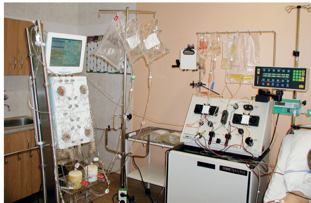
Foto 1 Přístrojové vybavení při LDL-aféřeze.

Princip reohemaferézy (RHF): U RHF je plazma, získaná stejným postupem jako u IA, proháněna “dru-