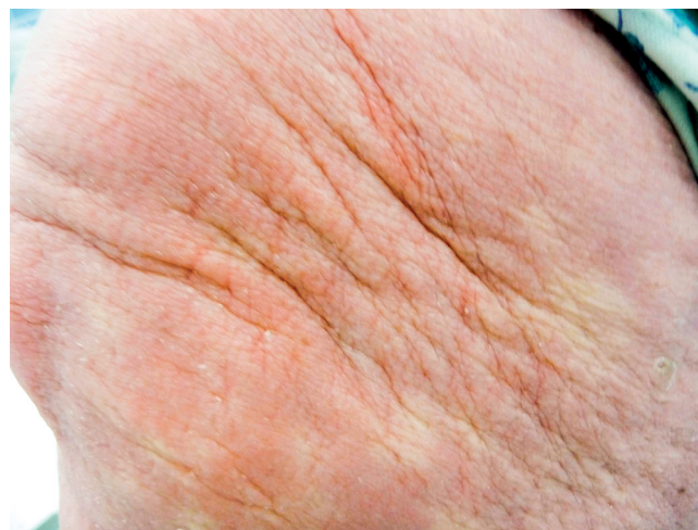
Obr. 3 Struktura ztlustělé kůže pacientky se skleromyxedémem

Histopatologické vyšetření válečku kostní dřeně prokázalo 2–4 % klonálních plazmocytů. Monoklonální imunoglobulin IgG kappa vstupně dosahoval koncentrace 9,0 g/l. Literatura popisuje souvislost skleromyxedému s Mlg, proto byla indikována léčba vedoucí k potlačení tvorby Mlg, i když diagnóza odpovídala monoklonální gamapatii nejasného významu (MGUS). Byla zvolena terapie pomocí kombinace cyklofosfamidů, bortezomibu a dexametazonu. Ta dosáhla poklesu Mlg z 9,0 g/l na 3,9 g/l. V průběhu léčby se dočasně zmenšily i kožní projevy. Pacientka uvedla, že pociťovala částečné změknutí kůže a podkoží, ale změny na kůži odpovídající skleromyxedému byly stále patrné. V roce 2010 proběhlo poslední kontrolní histopatologické vyšetření kůže. Patolog popsal rozšíření dermis