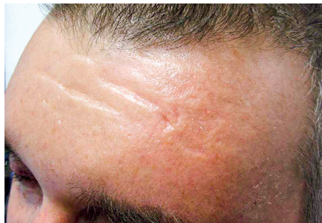
Obr. 4 Čelo pacienta se skleredémem

200 mg/m 2 s následnou transplantací autologních periferních buněk). Kompletní remise trvala 5 let, v roce 2017 začal recidivovat jak myelom, tak i kožní projevy. Pacient odmítl další léčbu a v září 2018 zemřel. Uvedený případ dokumentuje, že léčba (klasická chemoterapie zakončená vysokodávkovanou chemoterapií) vedoucí k úplnému vymizení Mlg vedla i k úplnému a dlouhodobému vymizení kožních i mimokožních projevů skleredému, jak dokumentují obrázky 4 a 5.