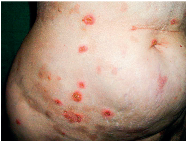
Obr. 7 Kožní puchýřnaté onemocnění IgA pemfigus u pacientky s mnohočetným myelomem

(kombinace bortezomib, cyklofosfamid, dexametazon) dovedla pacientku do kompletní remise mnohočetného myelomu, došlo k vymizení Mlg. Paralelně s vymizením Mlg vymizely i kožní morfy pemfigu. Kompletní remise trvala 3 roky a po tuto dobu byla pacientka bez kožních morf. Recidiva nemoci byla spojená s obnovením kožních morf, čím vyšší koncentrace Mlg typu IgA, tím více kožních morf. Léčba recidivy byla neúspěšná a pacientka nemoci nakonec podlehla. Tento případ demonstruje možnost, že Mlg může být také etiologickou příčinou pemfigu. Kožní změny dokumentují obrázky 7 a 8.