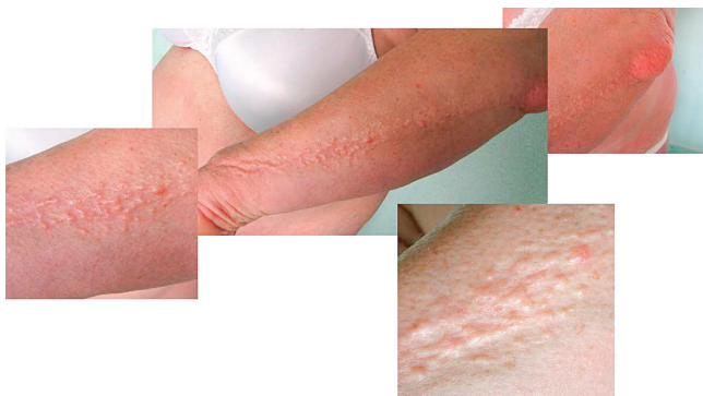
Obr. 1 Fotografie kůže pacientky se skleromyxedémem: zřetelná lineární konfigurace papul

Žena se systémovými projevy mucinózy typu skleromyxedému a současně s přítomností Mlg přišla na naše pracoviště poprvé v prosinci 2009, tedy ve věku 60 let. Tato pacientka měla povšechně zesílenou kůži a podkoží a dále měla v oblasti předloktí, na rukou a na obličeji papulózní kožní projevy béžové barvy a voskového lesku. Kůže zesílená mucinovými hmotami měla střídavě bledou a lividní barvu (obr. 1–3).