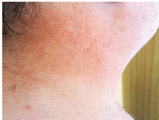
Obr. 6 Kůže v oblasti krku u pacienta se skleredémem

stolice maximálně 1× týdně. Byla provedena biopsie a histologické hodnocení kůže a podkoží. Jak histologický nález zmnoženého mucinu v celé retikulární dermis , tak klinický nález odpovídaly diagnóze skleredém ( skleroedema adultorum Buschke ). Vzhledem k současnému průkazu nálezů Mlg typu IgG kappa byl pacient dále směřován na hematologii. Histopatologické vyšetření válečku kostní dřenej prokázalo 5 % klonálních plazmocytů. Zobrazovací vyšetření neprokázalo žádné postižení skeletu, diagnostická kritéria pro mnohočetný myelom nebyla naplněna.