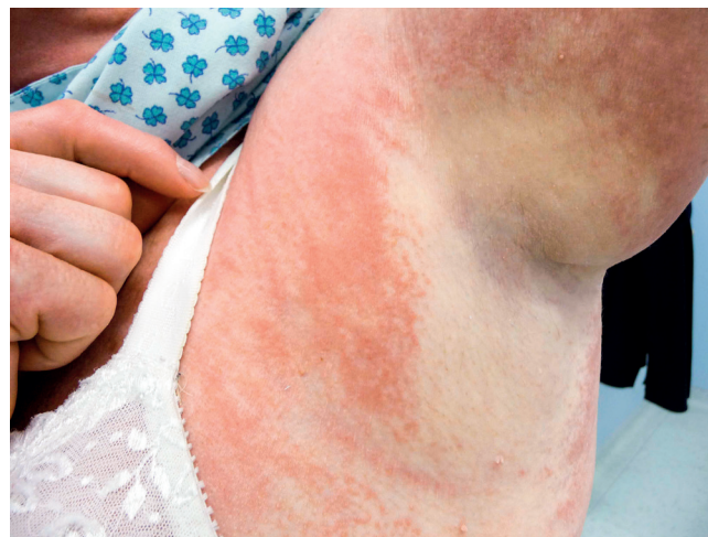
Obr. 2 Mramorovaná kůže pacientky se skleromyxedémem: místy bledá, místy lividní