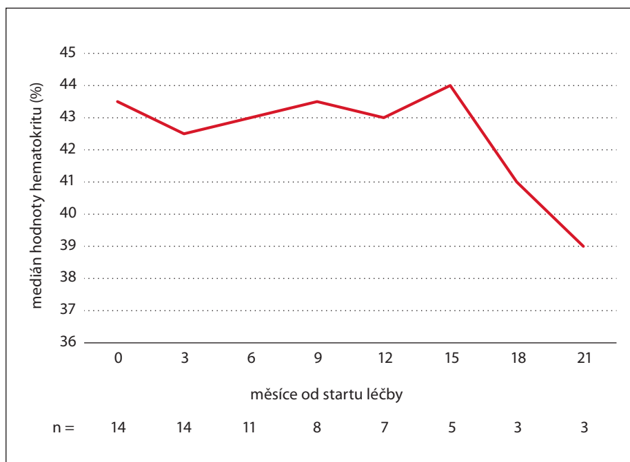
Graf 1. Vývoj mediánu hladiny hematokritu od zahájení léčby ropeginterferonem alfa-2b ve sledovaném souboru.