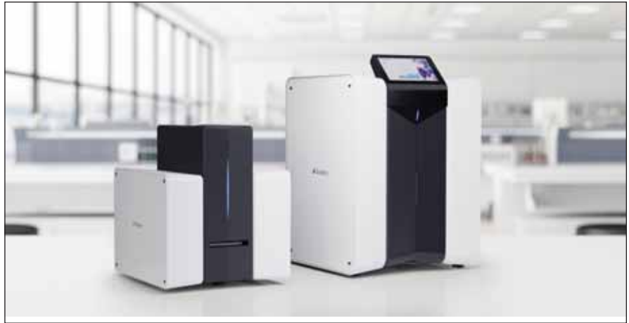
Obr. 2. Dvě kapacitní varianty zařízení Scpio.